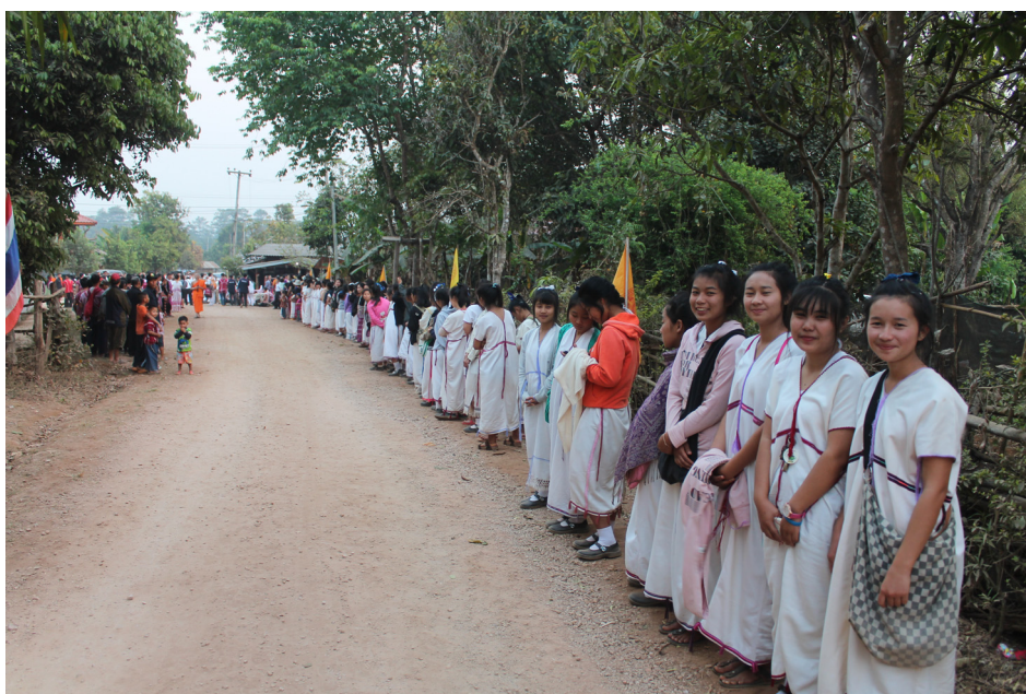
ต้อนรับโครงการธรรมจาริก