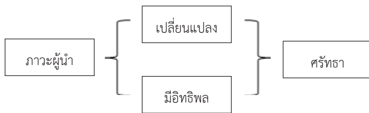
ภาพที่ ๑ ภาวะผู้นำที่มีอิทธิพล การเปลี่ยนแปลง และมีศรัทธา

จากความหมายดังกล่าวสรุปได้ว่า ภาวะผู้นำ ต้องเป็นผู้นำที่มีอิทธิพล มีความสามารถในการสร้างศรัทธา ในการทำงานและได้รับความร่วมมือร่วมใจจากองค์กรในการปฏิบัติงานให้บรรลุวัตถุประสงค์ ดังภาพที่ ๑ ซึ่งมีรายละเอียดดังนี้